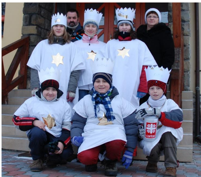
Tříkrálová sbírka r.2008

Tříkrálová sbírka se uskutečnila v naší obci 9.ledna 2021 z důvodu pandemie při vybírání polatku za popelnice. Vybralo se 9020,- Kč a někteří občané zaslali svůj příspěvek na účet Charity.